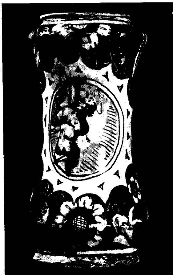
Fig. 3. — Albarello. (Ceramica - Dimensioni: 28,5 x 13,5 cm. - Epoca: inizio del sec. XVII - La Valletta, Museo Nazionale).

me ad un orciolo di maiolica (fig. 5) e ad un mortaio di bronzo — in un francobollo emesso il 21 Marzo 1970 dal Governo di Malta nella serie commemorativa della 13 a Esposizione d'Arte del Consiglio d'Europa.