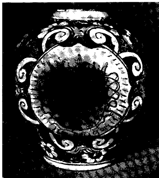
Fig. 6. — Lo stesso del precedente. Stemma del Gran Maestro Alof de Wignacourt.