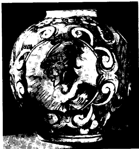
Fig. 5. — Orciolo. (Ceramica - Dimensioni: 28,5 x 24,5 cm. - Epoca: inizio sec. XVII. - Manifattura: Urbino? Caltagirone? - La Valletta, Museo Nazionale).

Terminiamo questa breve nota, mettendo in evidenza che nessuno dei vasi qui riprodotti porta l'iscrizione del medicamento in esso contenuto; si tratta cioè di «vasi generici», sui quali si applicava di volta in volta un'etichetta di carta riportante il nome del farmaco ed eventualmente la data di preparazione.