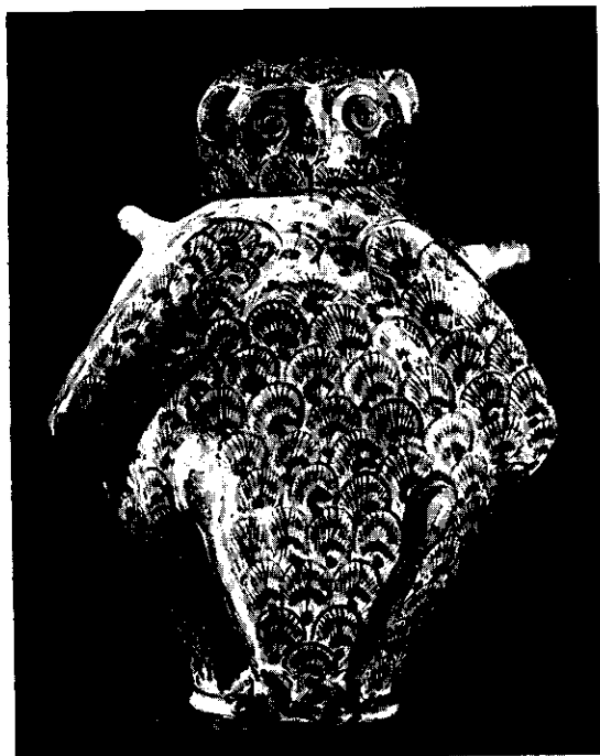
Fig. 1. — Vaso di farmacia a forma di gufo. (Ceramica - Dimensioni: 58 x 38 cm, Epoca: sec. XVIII. La Valletta, Museo Nazionale).