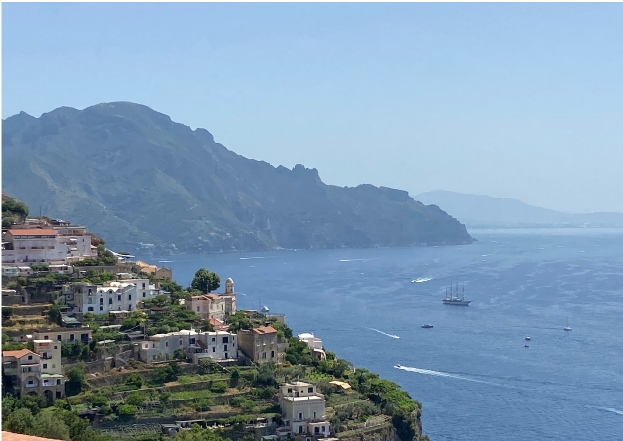
Fig. 2 I terrazzamenti della Costiera, sui quali sopravvivono, armoniosamente integrate, le case a volta estradossate

consolidato, nella contestuale considerazione degli annessi aspetti sociali, produttivi e, soprattutto, funzionali, cioè legati al problema di una scelta adeguata di destinazioni d'uso compatibili con le esigenze di conservazione 7 .