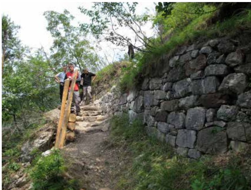
Verso Forte Fornas