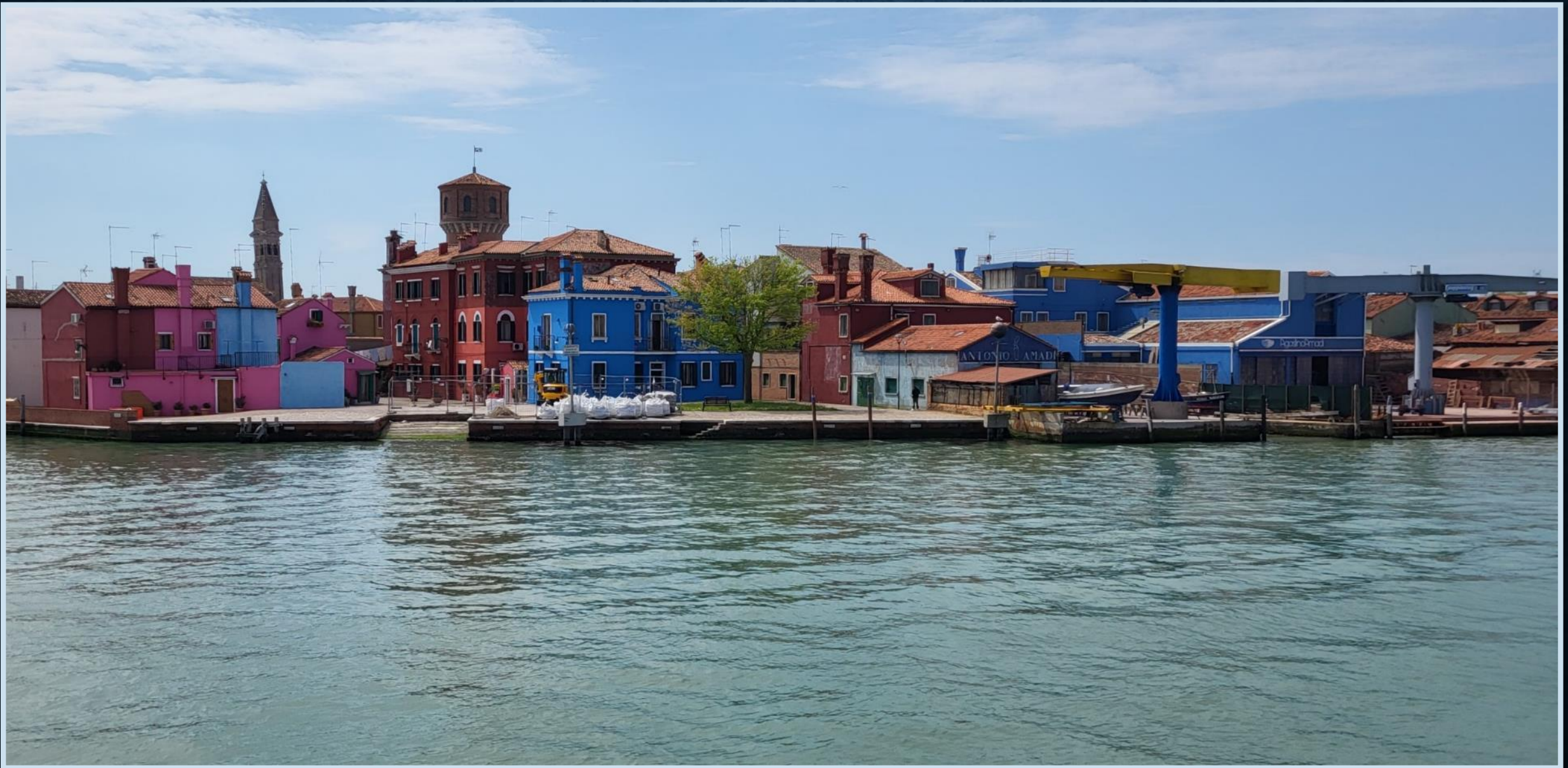
Isola di Burano