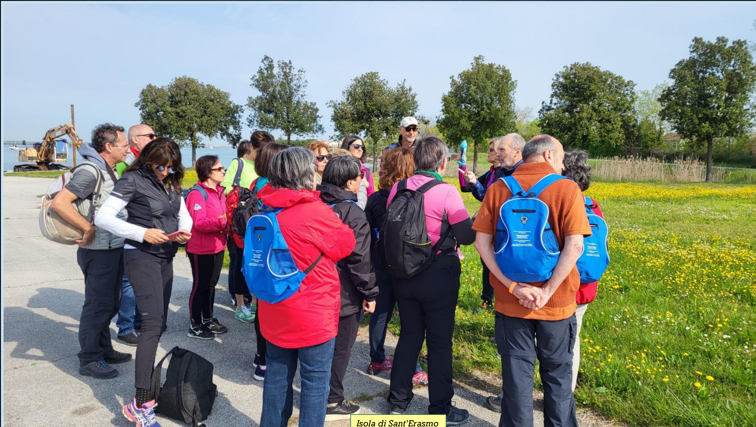
Isola di Sant'Erasmo