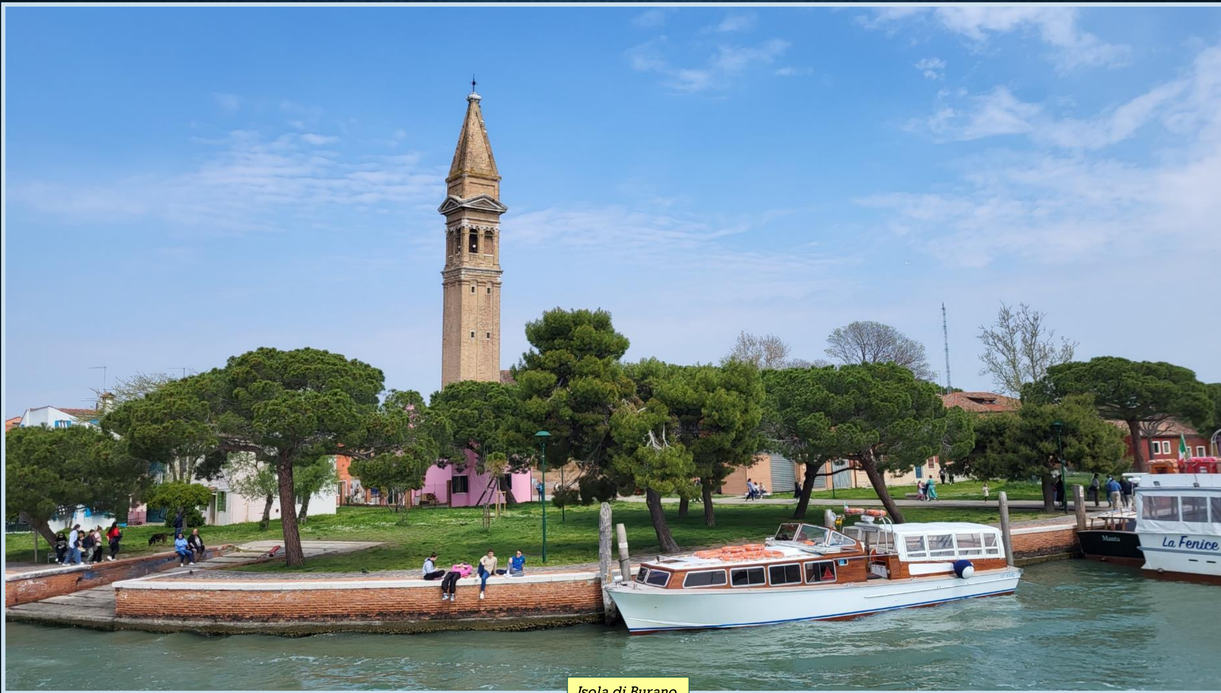
Isola di Burano