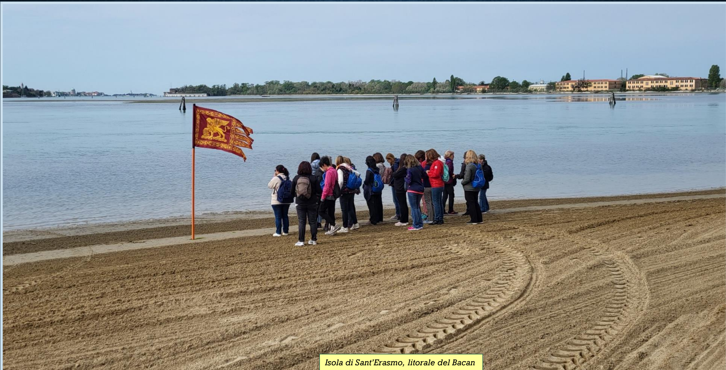
Isola di Sant'Erasmus, litorale del Bacan