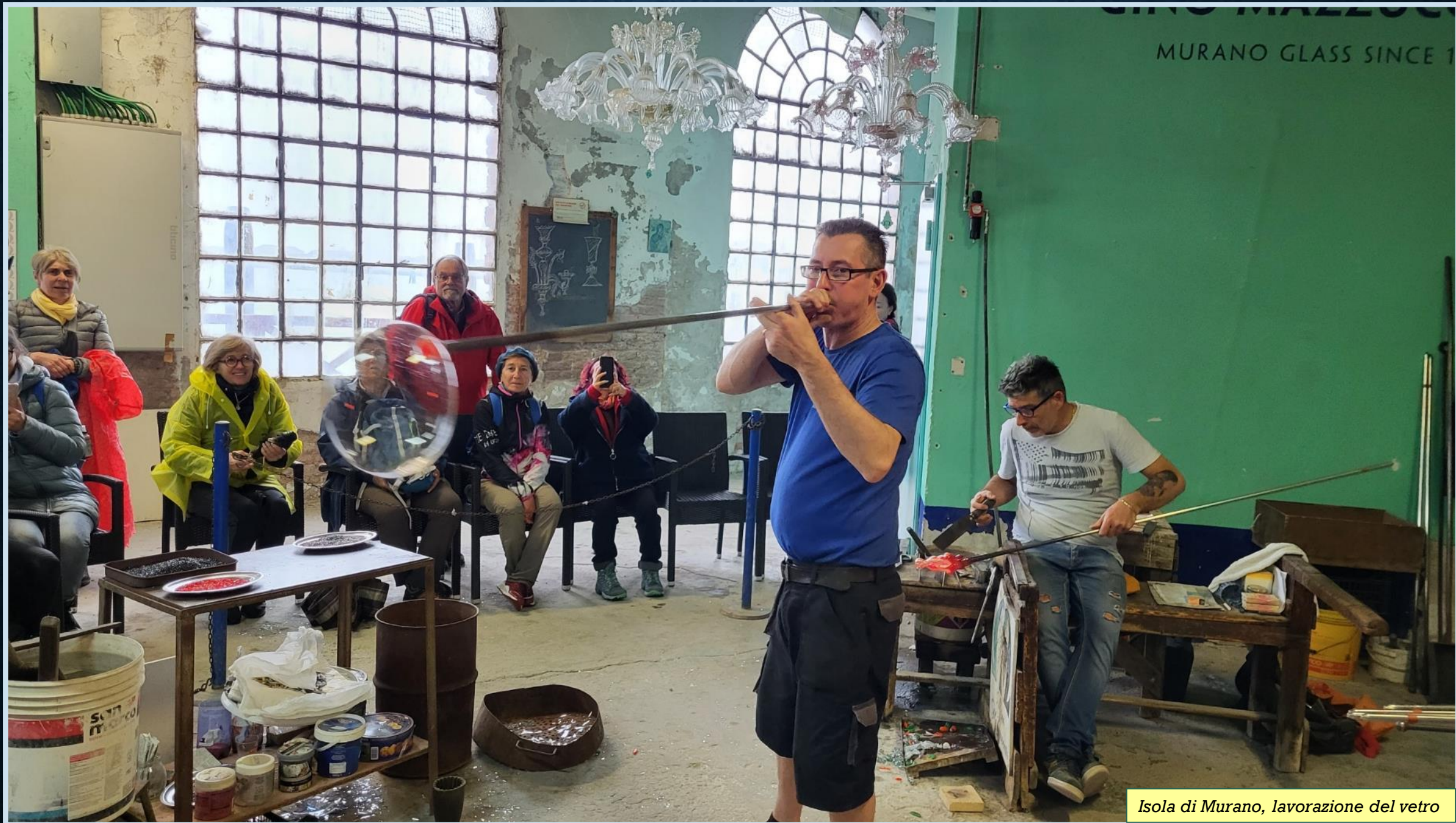
Isola di Murano, lavorazione del vetro