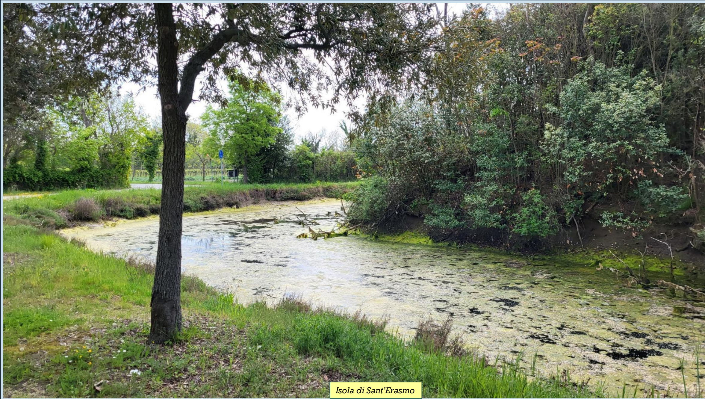
Isola di Sant'Erasmus