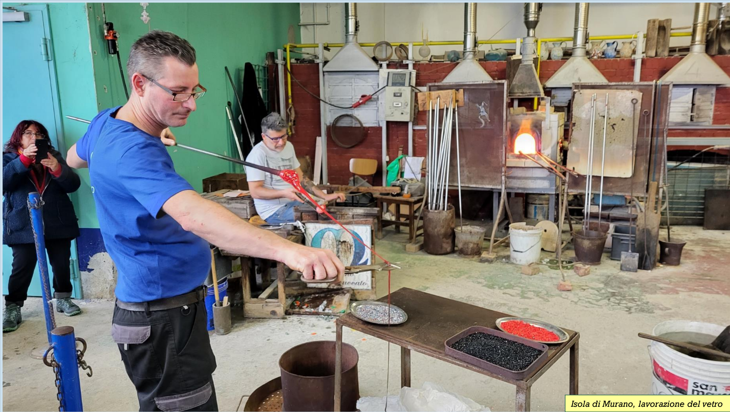
Isola di Murano, lavorazione del vetro