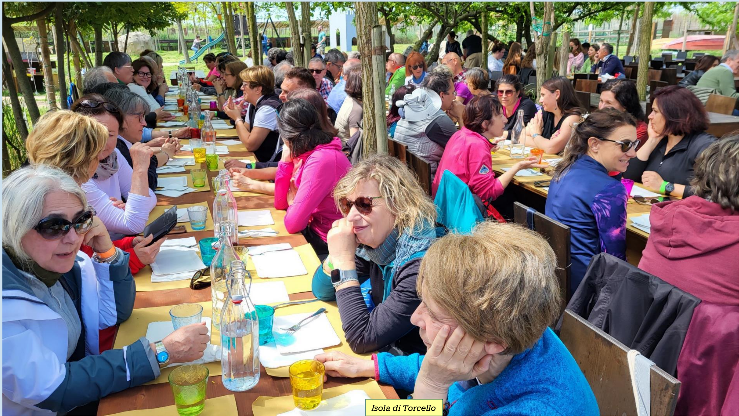
Isola di Torcello