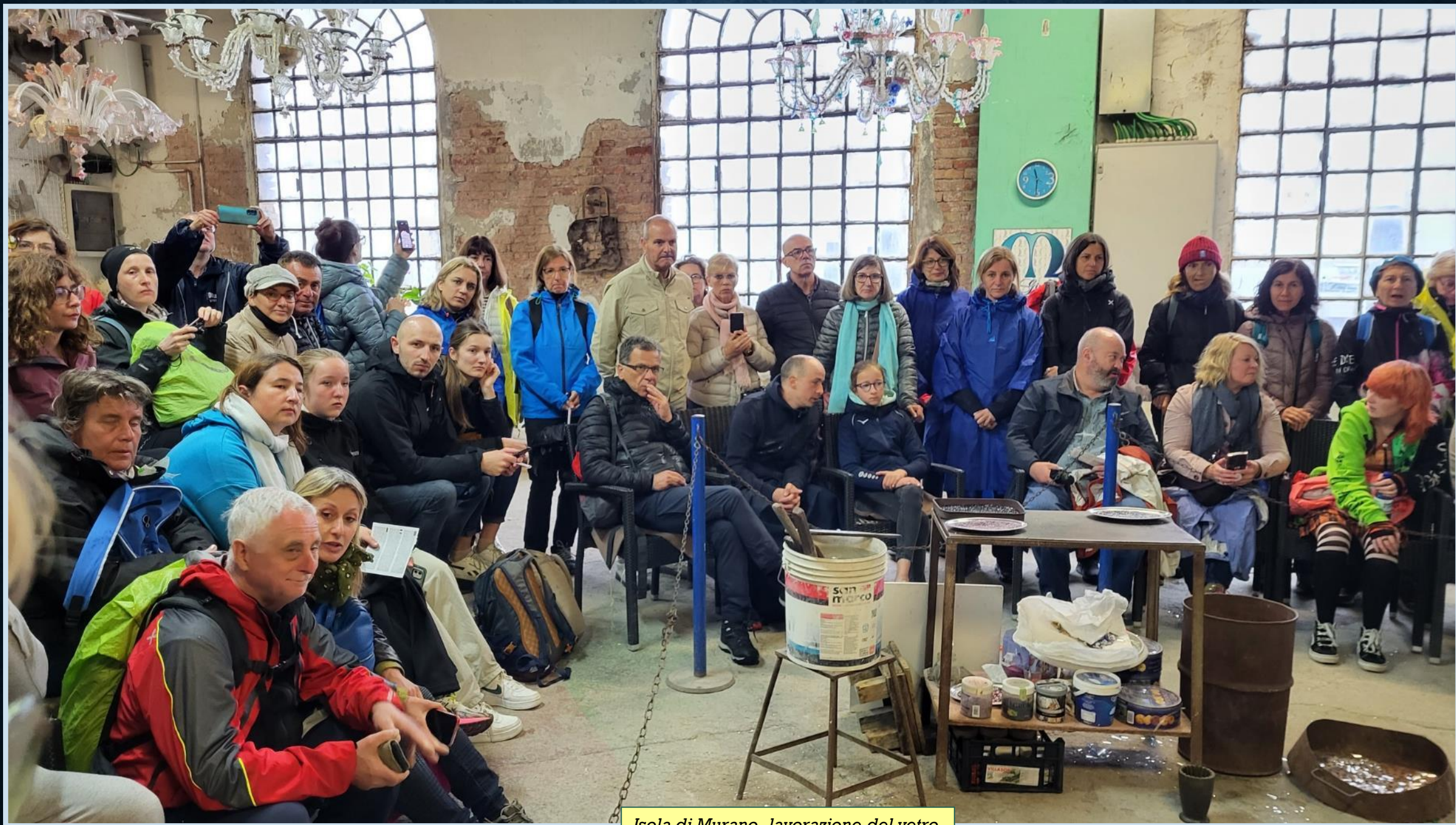
Isola di Murano, lavorazione del vetro