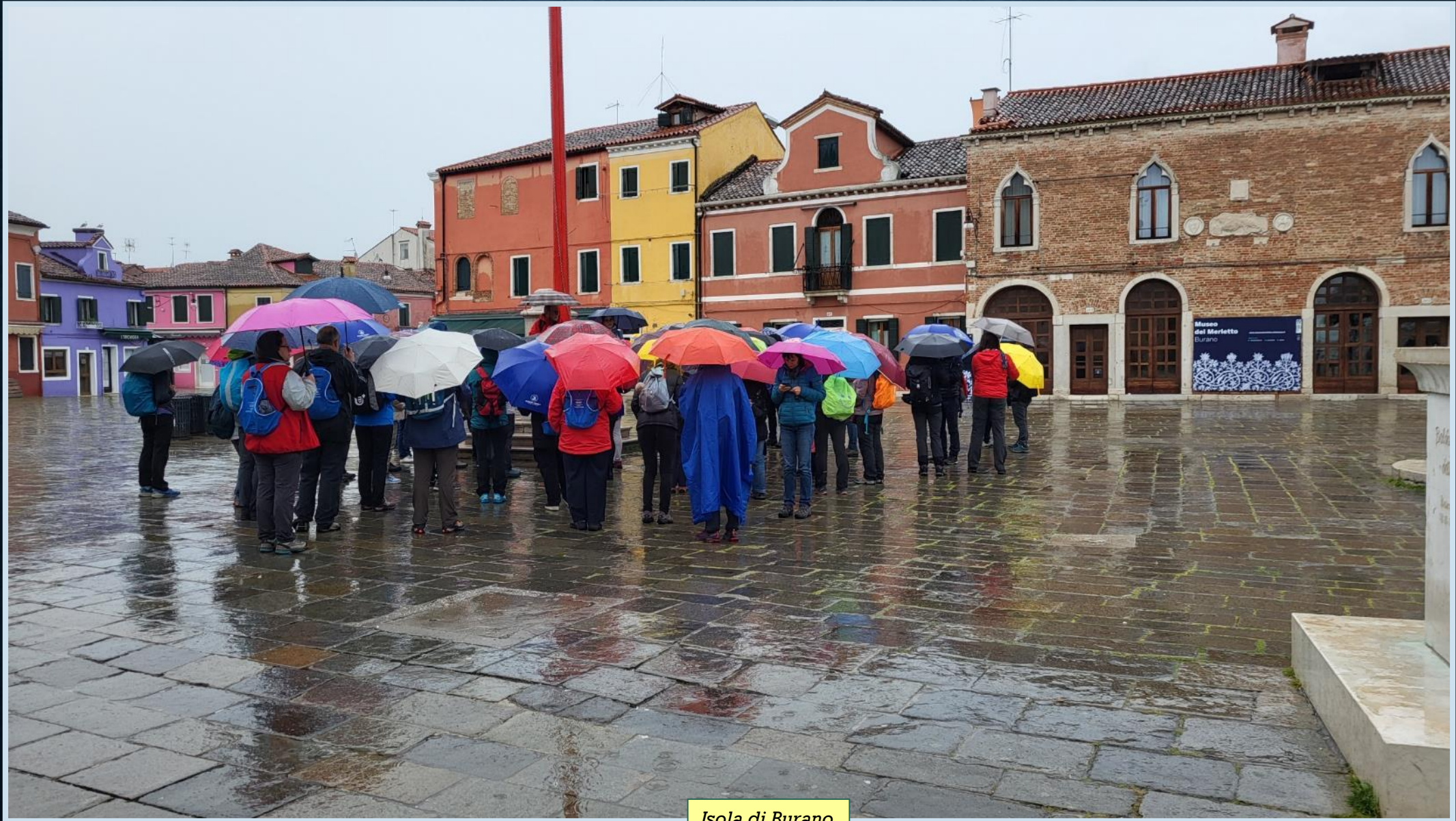
Isola di Burano