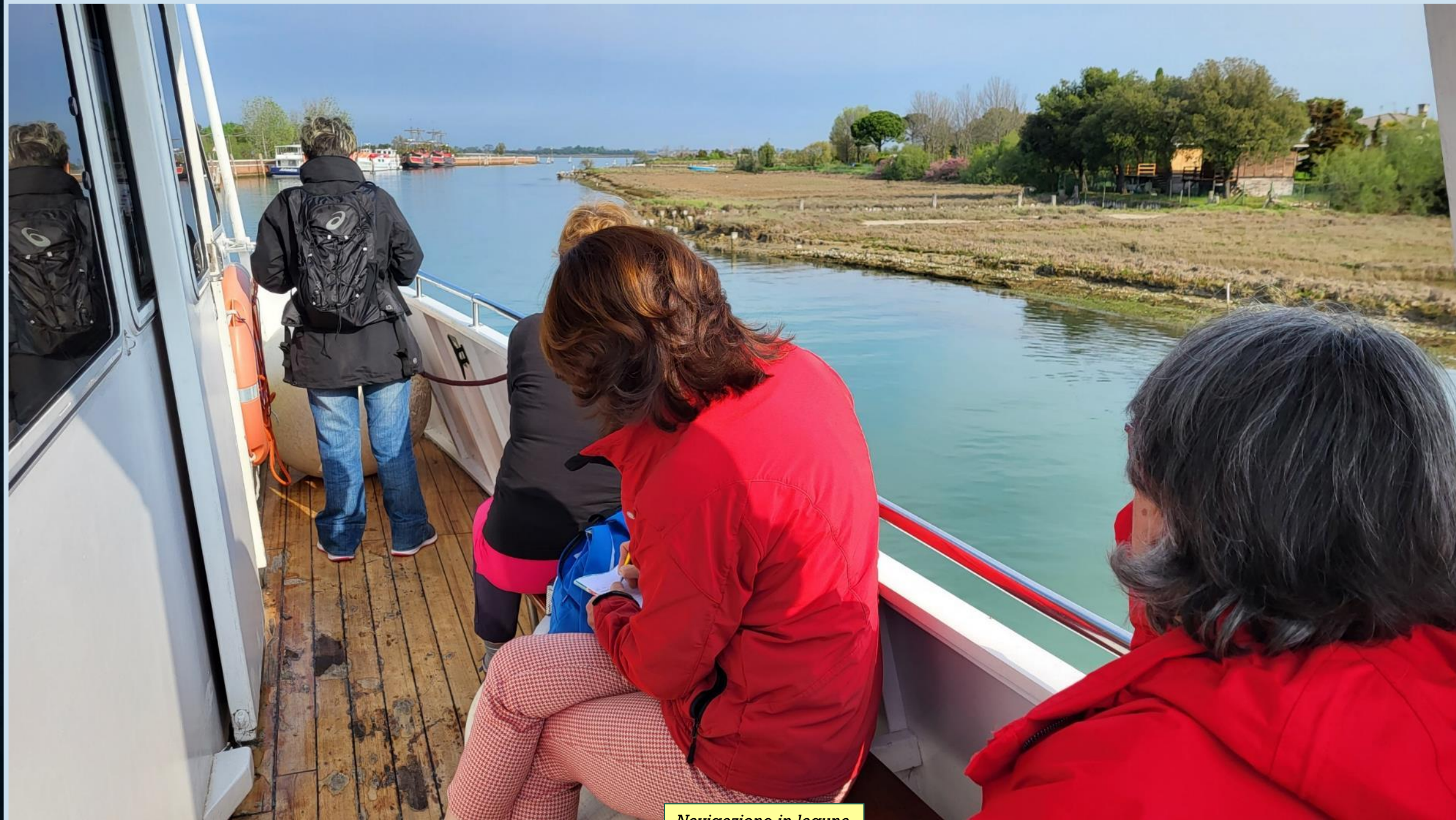
Navigazione in laguna