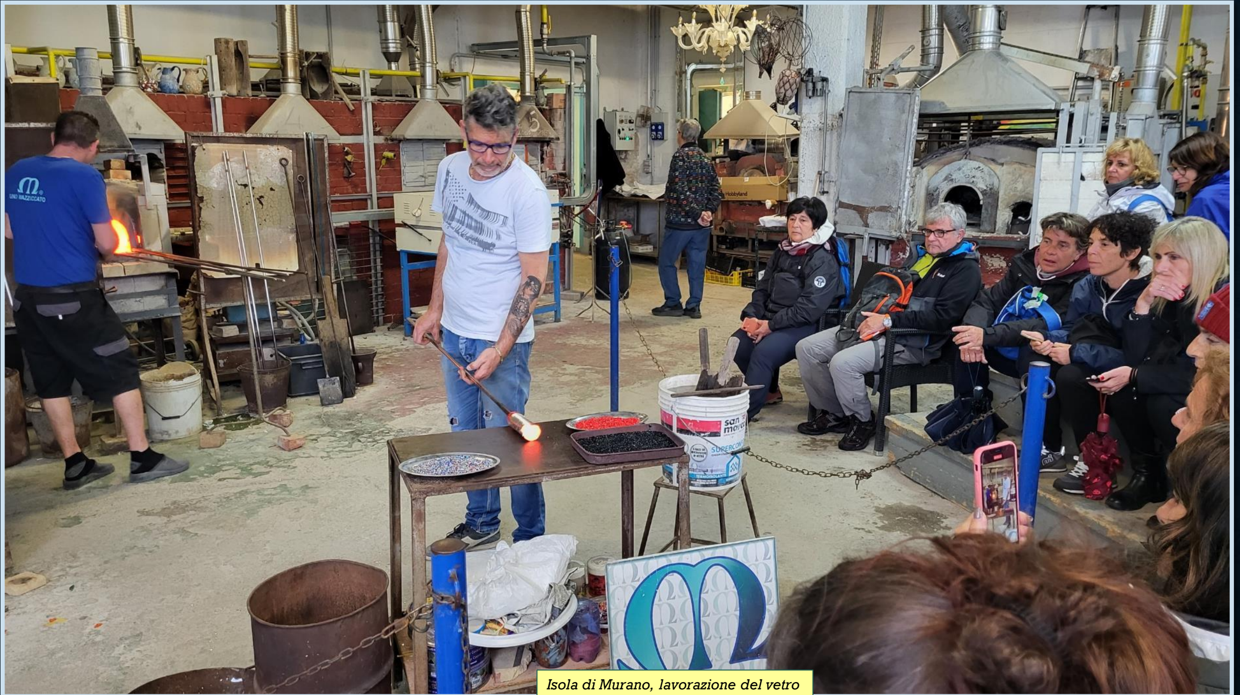
Isola di Murano, lavorazione del vetro