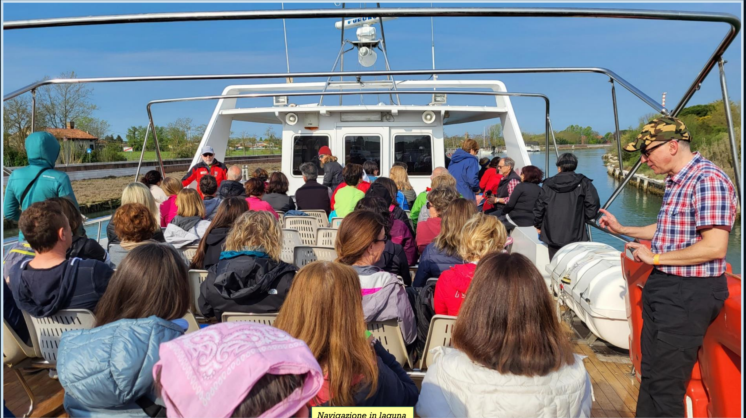
Navigazione in laguna