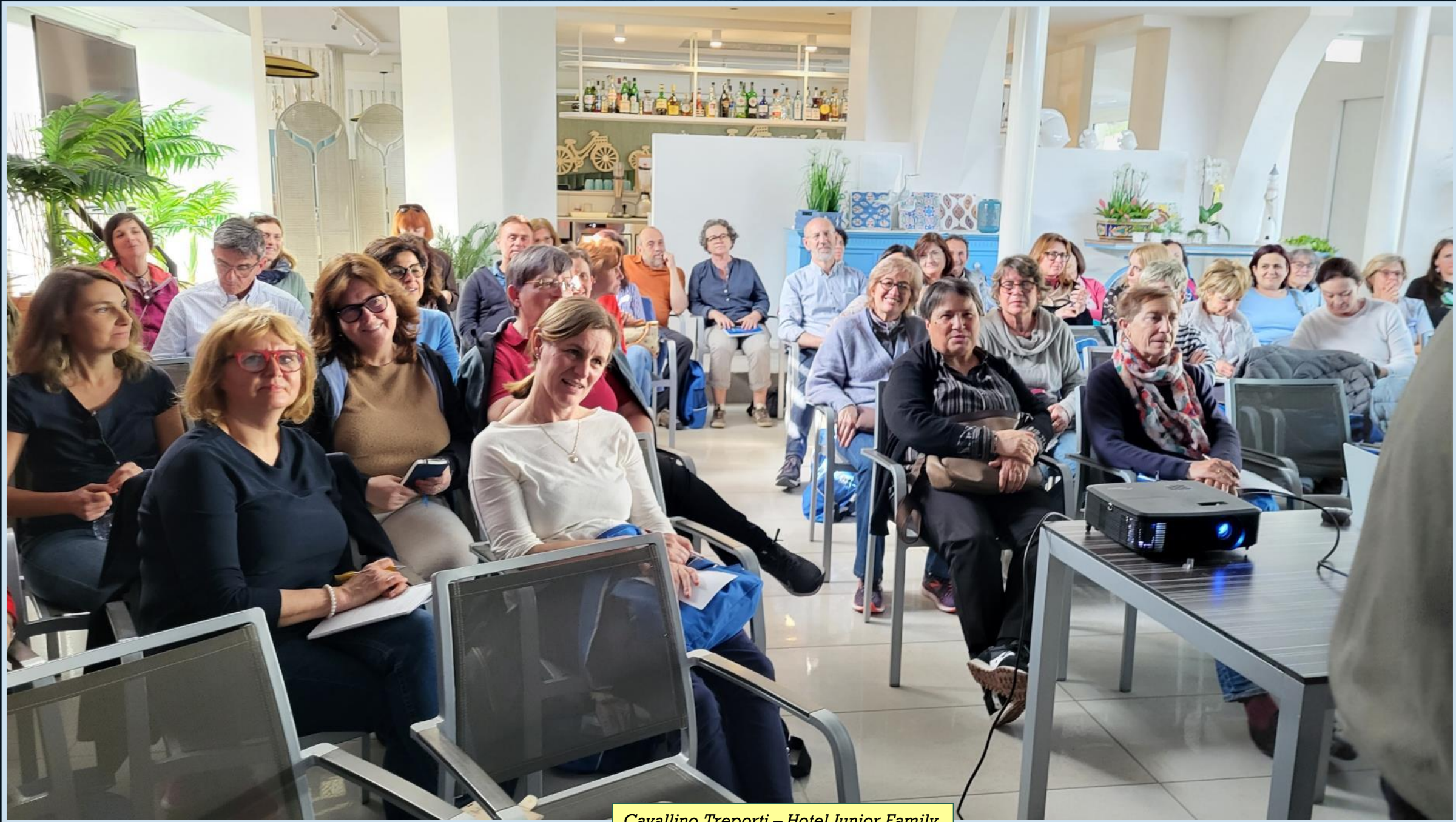
Cavallino Treporti – Hotel Junior Family