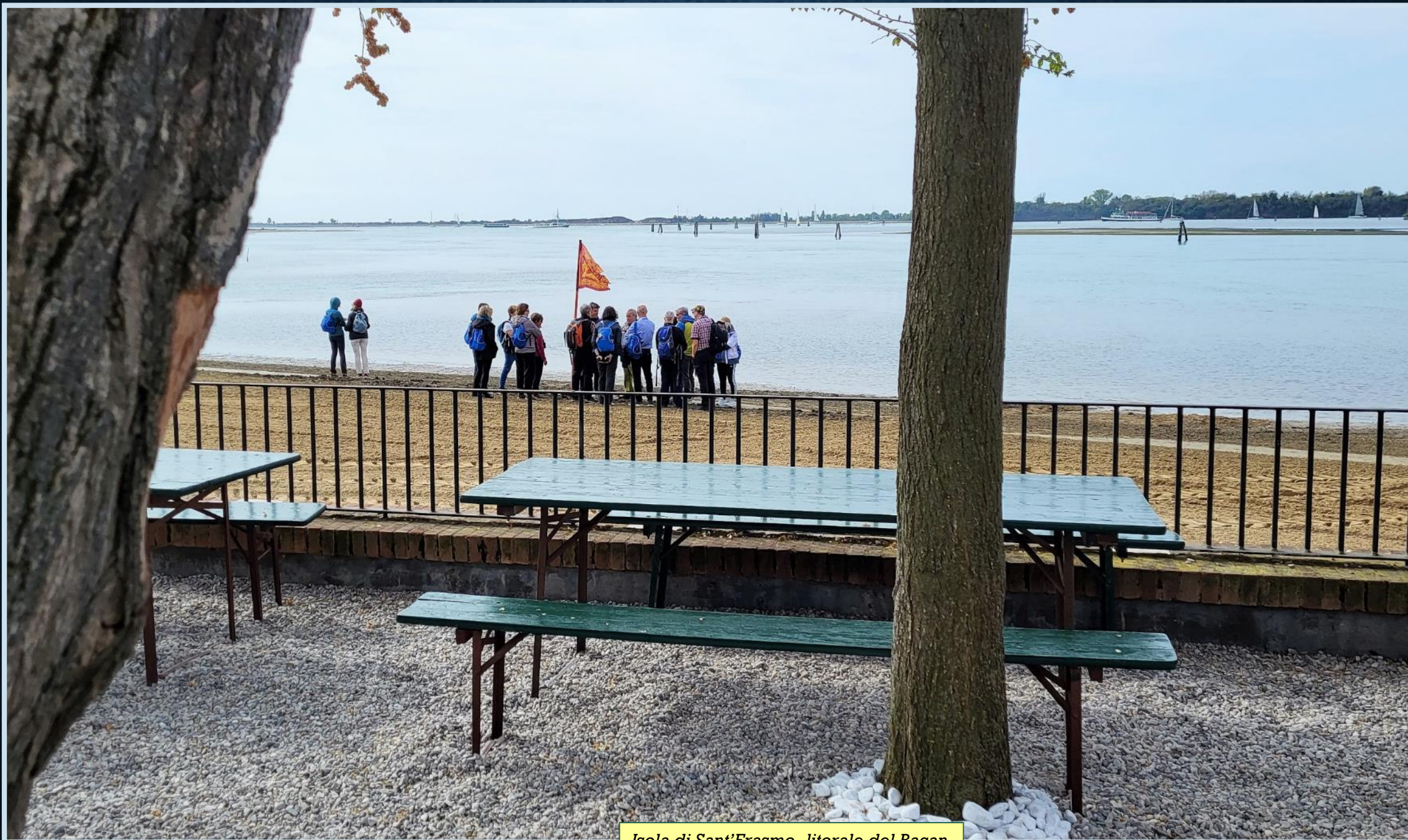
Isola di Sant'Erasmus, litorale del Bacan