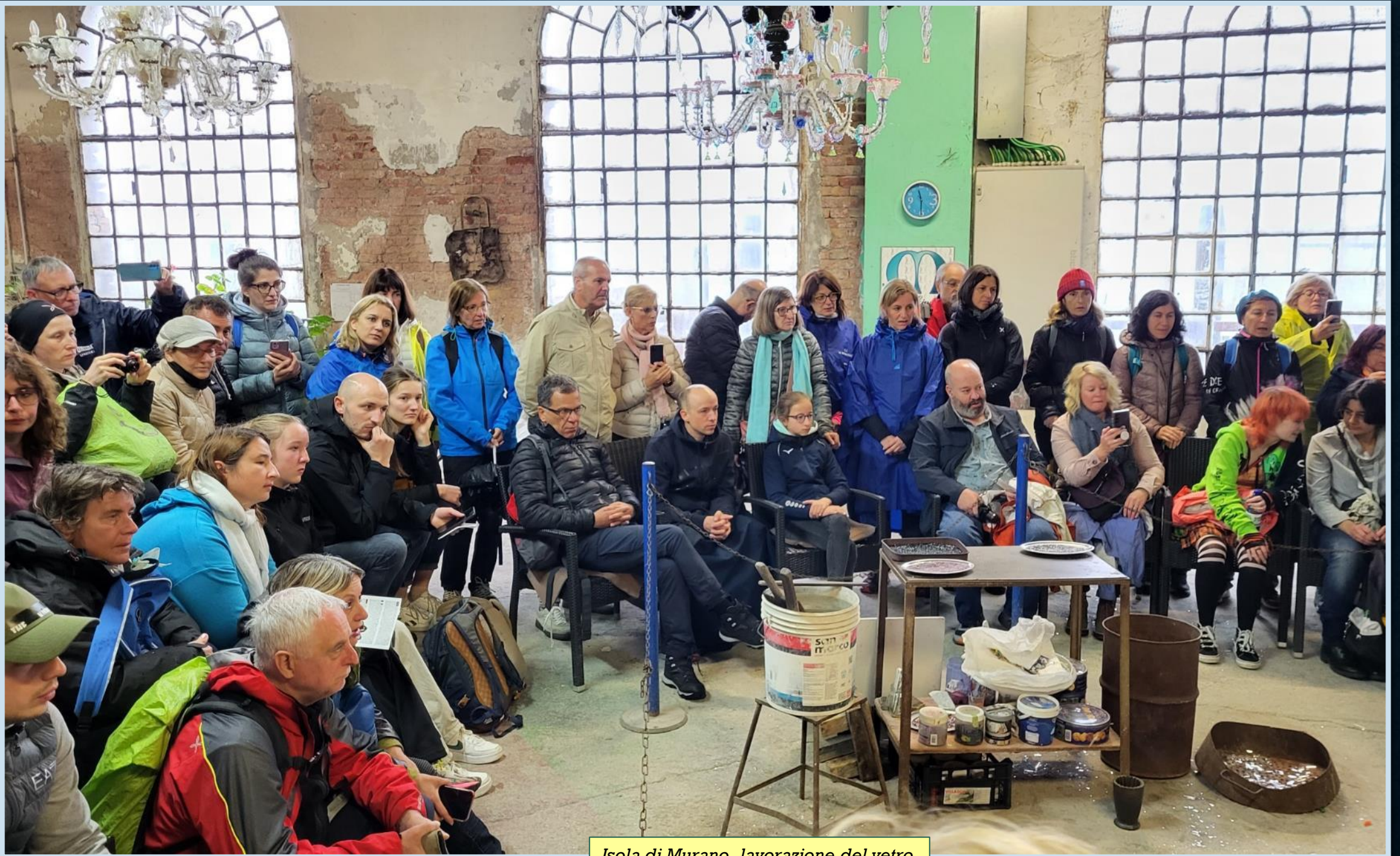
Isola di Murano, lavorazione del vetro