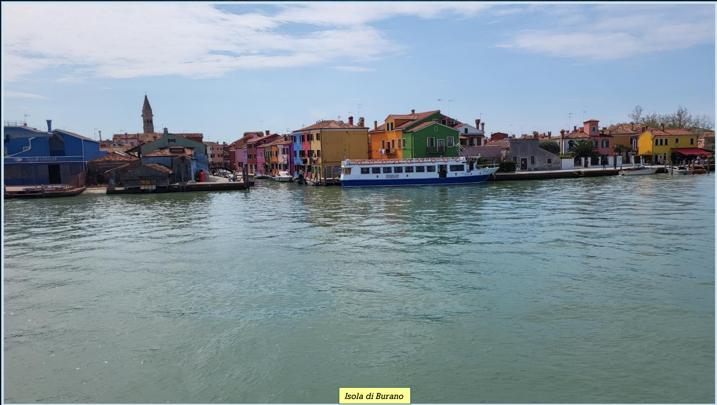
Isola di Burano