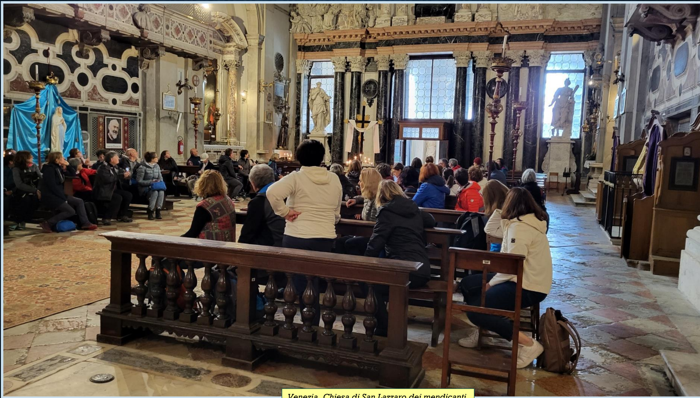
Venezia, Chiesa di San Lazzaro dei mendicanti