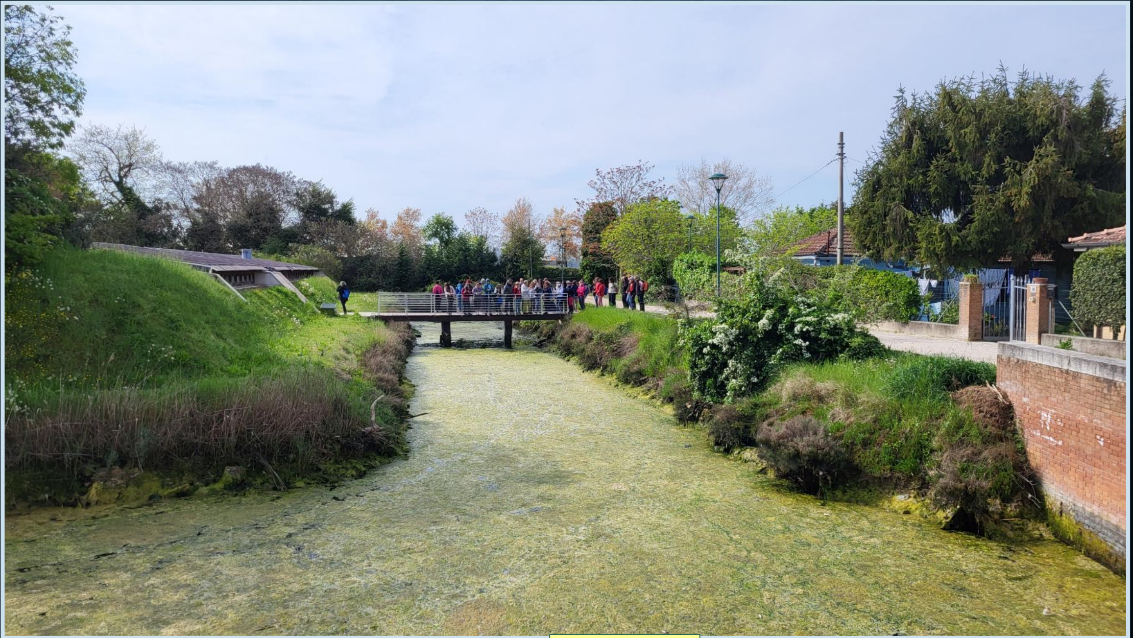
Isola di Sant'Erasmo