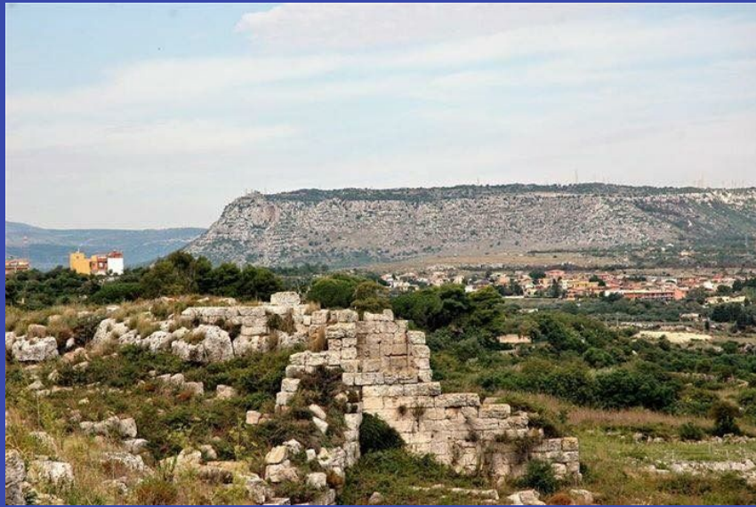
Resti delle mura Dionigiane