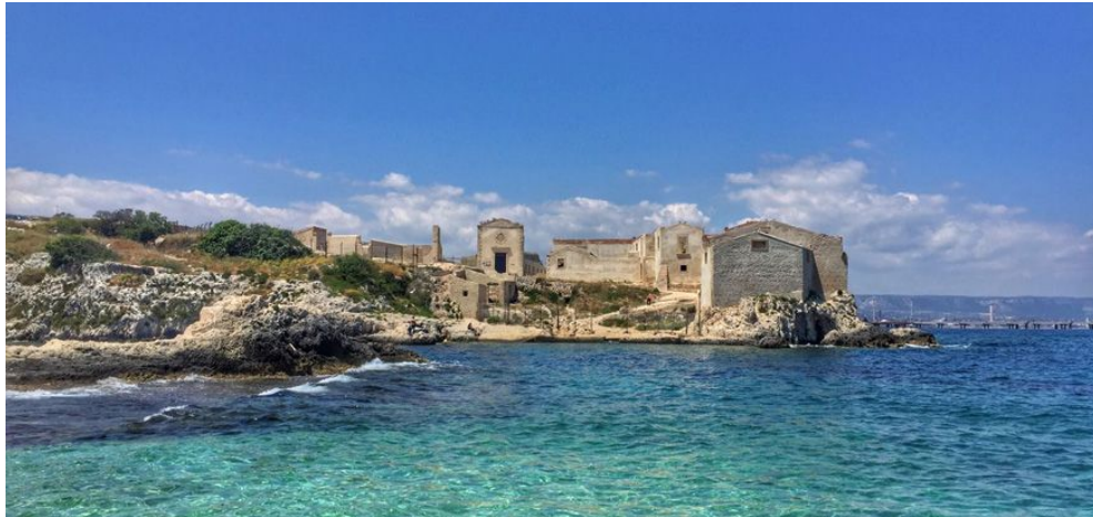
Tonnara di Santa Panagia