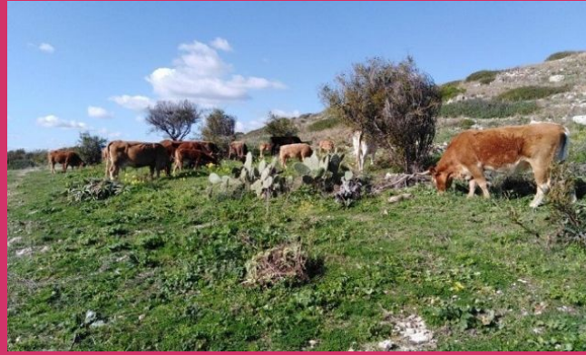
Animali da pascolo