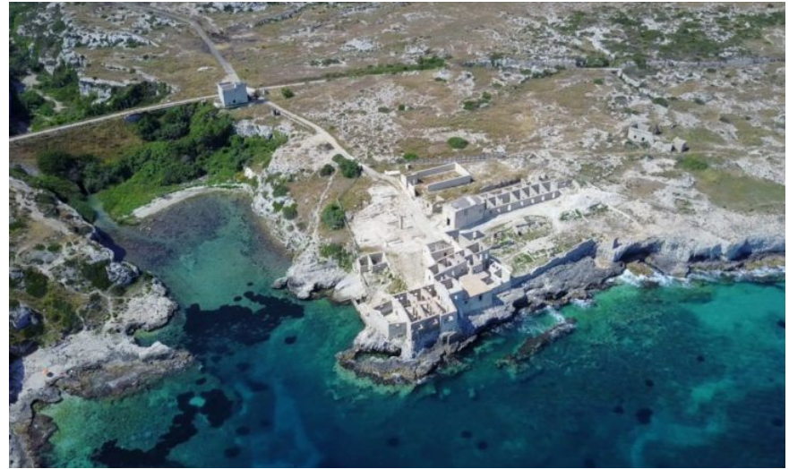
Porto del Trogilo