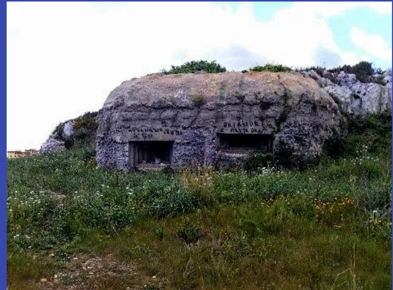
Bunker seconda guerra mondiale