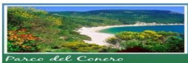
Parco del Conero

VALLE MIANO E LE TRE VALLI DI PIETRALACROCE