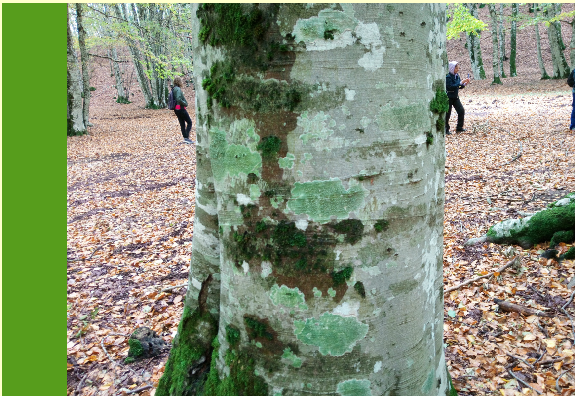
Monte Terminio AV: muschi e licheni