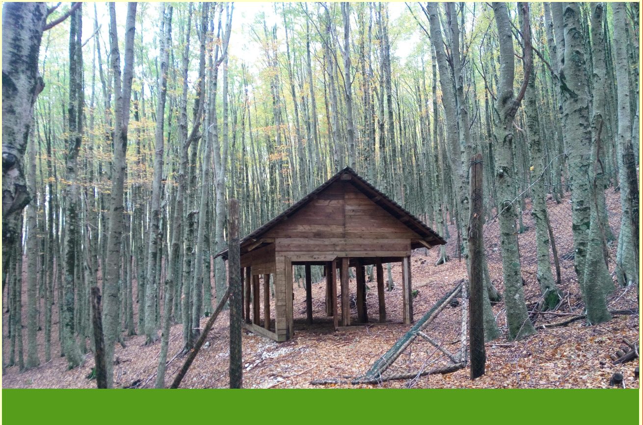
Monte Terminio AV: rifugio per cervi