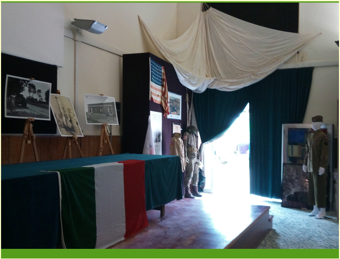
Salerno Museo dello Sbarco