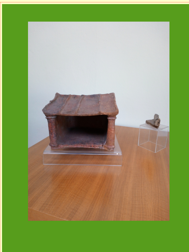
Museo archeologico Salerno: modellino fittile di casa IX a.C.