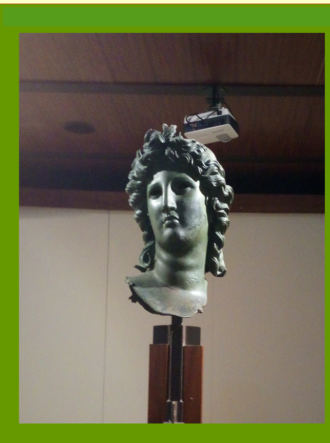
Museo archeologico Salerno: Testa di Apollo I sec.