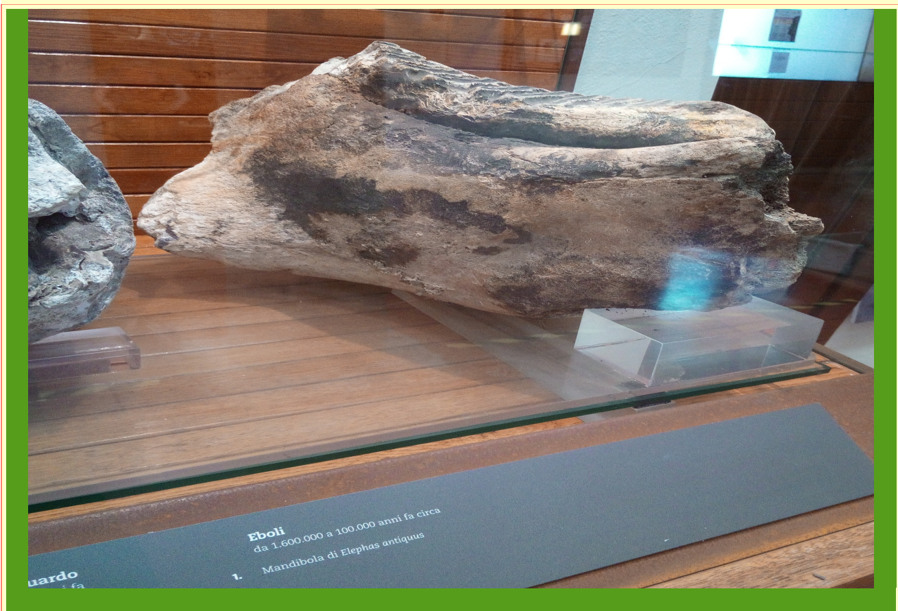
Museo archeologico Salerno: mandibola di Elephas