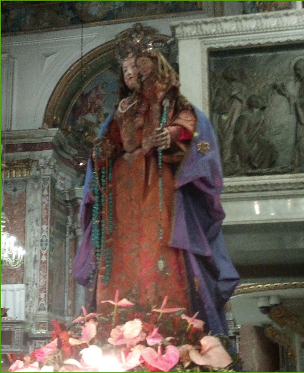
Cattedrale di Amalfi: Madonna con Bambino