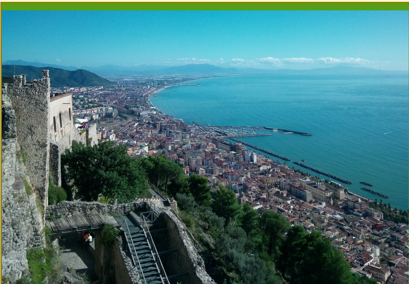
Salerno: veduta dal Castello Arechi