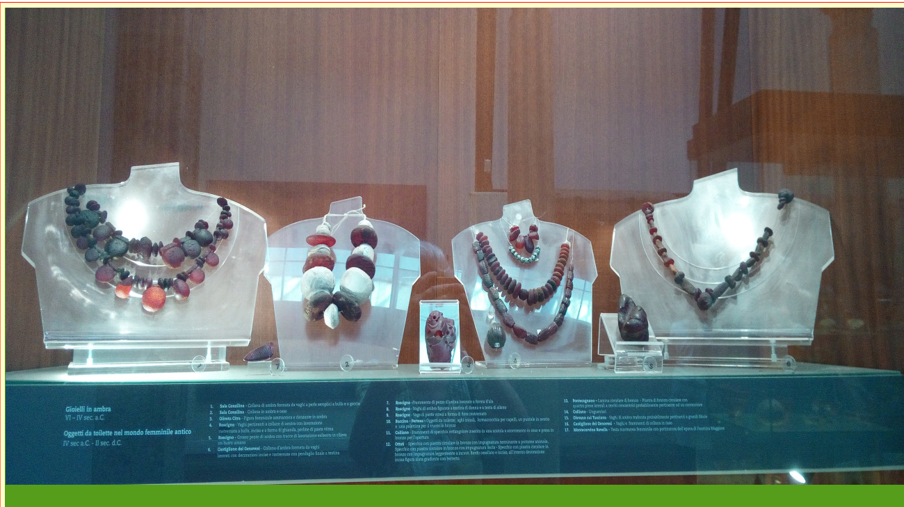
Museo archeologico Salerno: gioielli in ambra V secolo a.C.