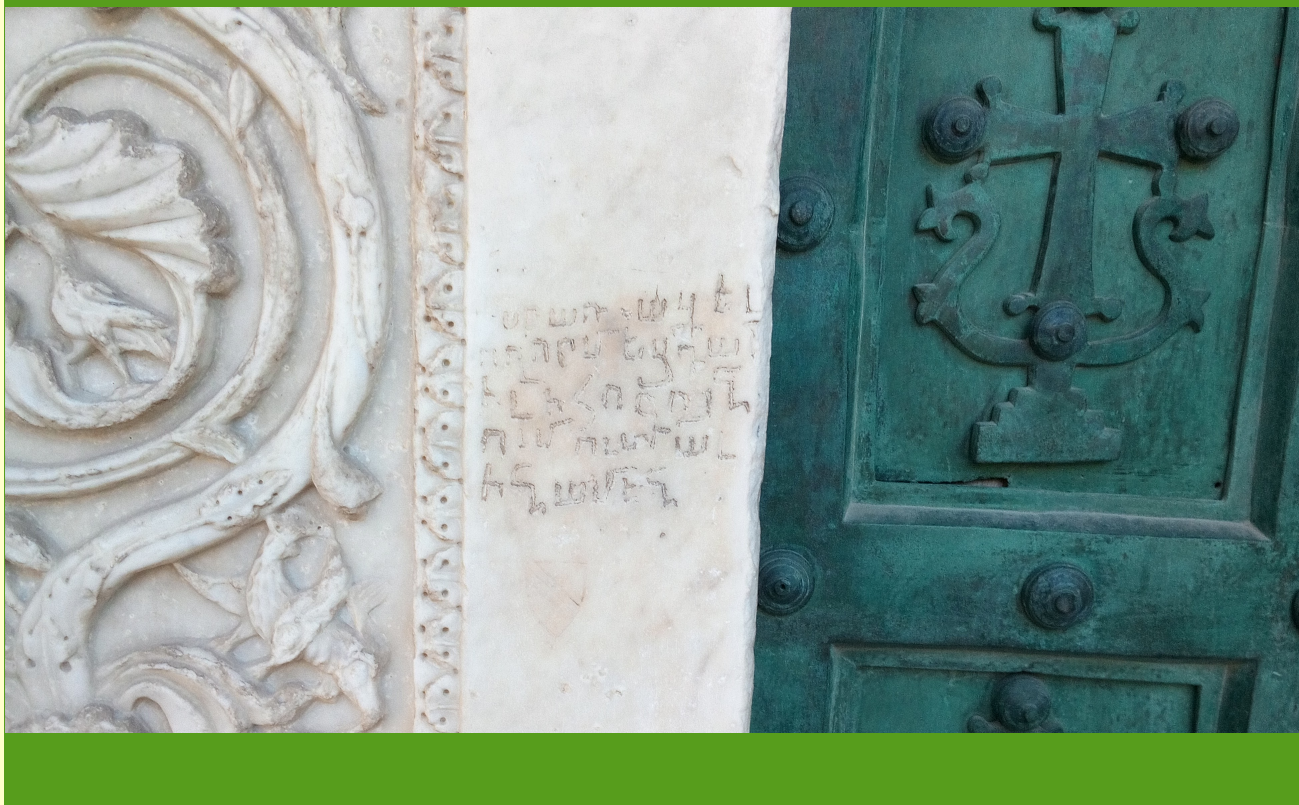
Cattedrale di Salerno: iscrizione del portale