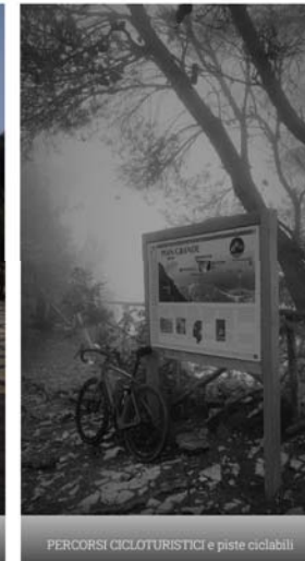
PERCORSI CICLOTURISTICI e piste ciclabili