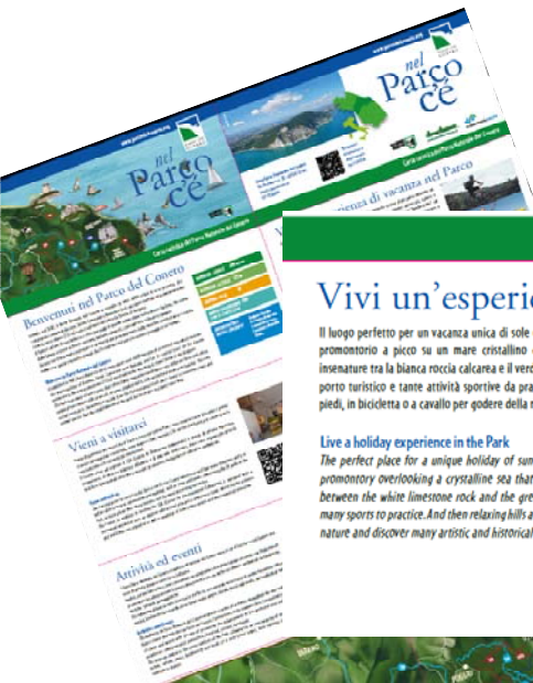
Carta turistica del Parco Naturale del Conero