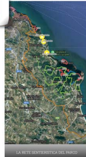
LA RETE SENTIERISTICA DEL PARCO