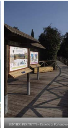
SENTIERI PER TUTTI - L'anello di Portonovo