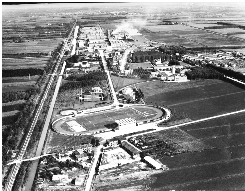
Vista aérea de Torviscosa