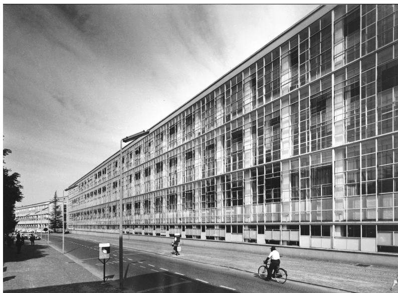
Luigi Figini y Gino Pollini. Fachada de los talleres de producción ICO . Ivrea. Años 50.