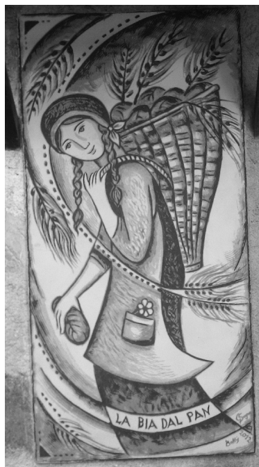
Cibiana di Cadore, murales