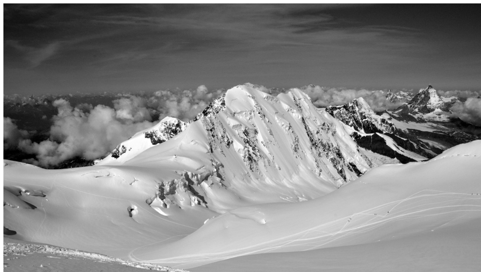
Lyscamm e Cervino (dal Colle del Lys, Monte Rosa)

Quaderno TAM n. 7 - Problemi energetici ed ambiente - del 2014