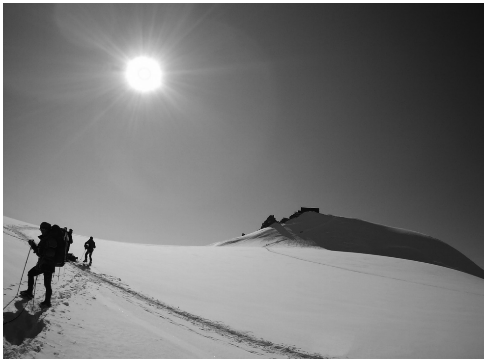
Monte Rosa - Punta Gniffetti, Capanna Regina Margherita (4554 m)