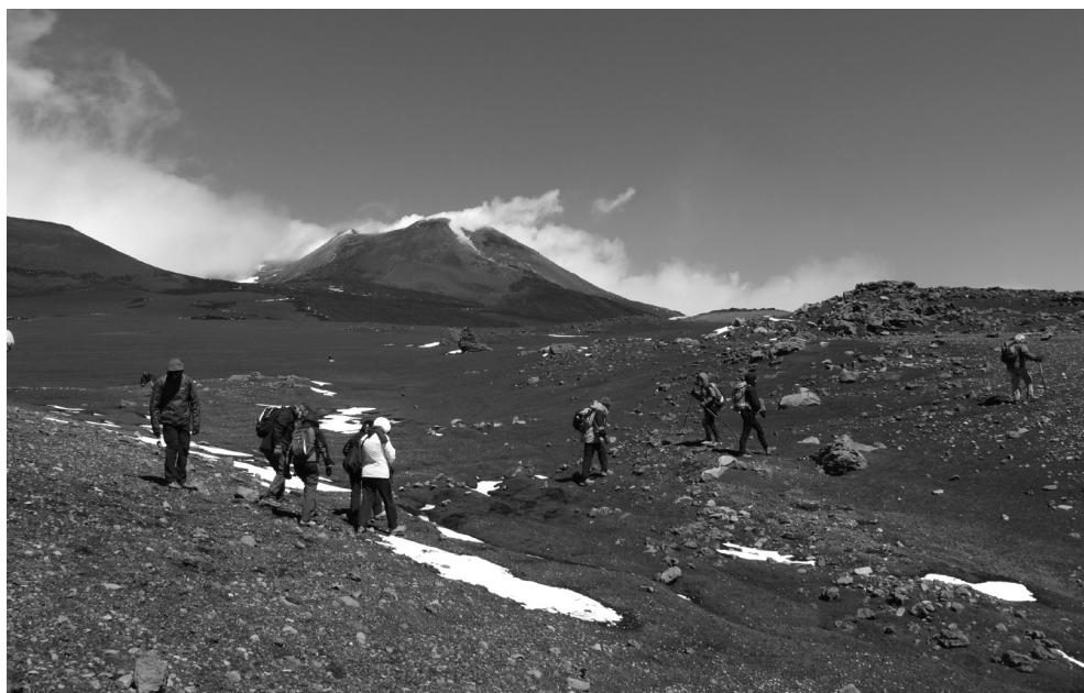
Etna, versante Sud - Piano del Lago zona Cisternazza

Occorre allora che il potere disciplinare sia esercitato a livello sezionale dal Consiglio Direttivo, a livello regionale dal Consiglio Direttivo Regionale, a livello nazionale dal Comitato Direttivo Centrale con le modalità previste dal regolamento disciplinare.