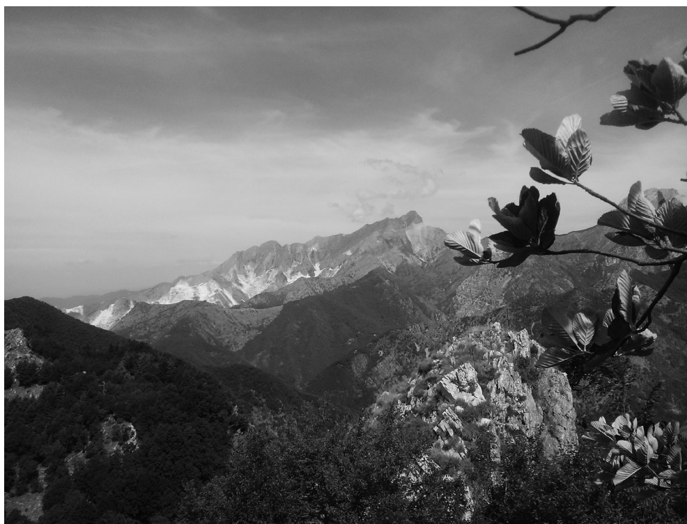
Apuane - Monte Sagro e bacino marmifero di Colonnata (dall'orto botanico Pietro Pellegrino)

Presidente Commissione Centrale Tam del CAI