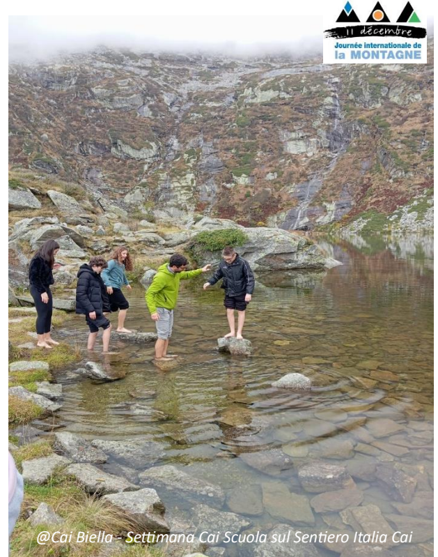
Settimana Cai Scuola sul Sentiero Italia Cai

Ricordiamo con interesse che il tema scelto per il 2019 è stato "Mountains matter for Youth" – "i giovani hanno a cuore la Montagna". Cai Scuola, con la preziosa e insostituibile opera di Sezioni e Soci, è vicina