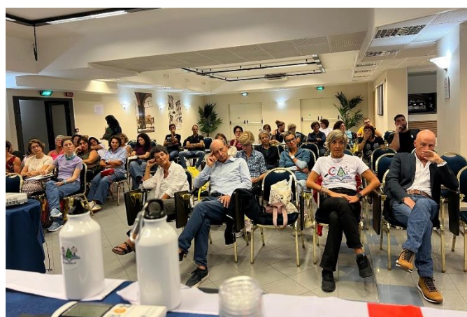
Cai Scuola in Sardegna – Evviva la borraccia Liberi dalla plastica