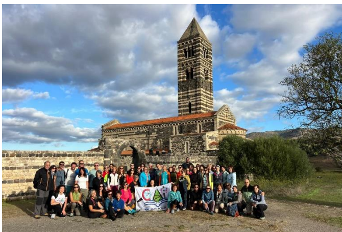
Cai Scuola in Sardegna – Corso formazione docenti, settembre 2025