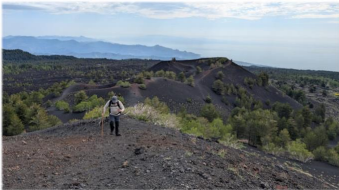
Monti Sartori 1735 m. slm